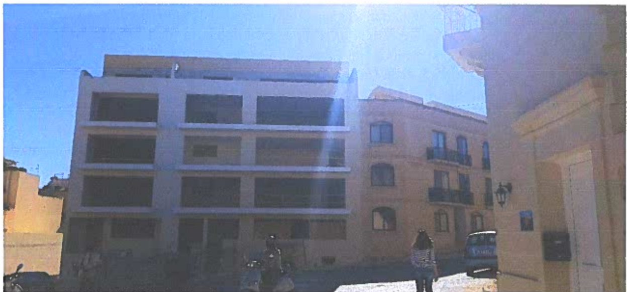
Blokka ohra ta' 5 sulari li spiccat sular 'l fuq mill-kumpless li jmiss maghha li nbena madwar 15 il sena ilu.