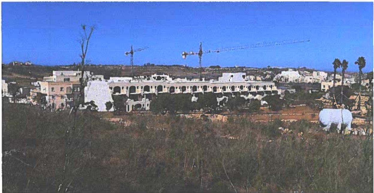
Photo 3 – Ritratt minn wara ta' parti mill kumpless. Din il-parti waheda tammonta ghal fuq minn 60 appartament. It-total ta' l-erbgha kumplessi flimkien ser jammontaw ghal 163 appartament

Din is-sezzjoni lahqet gholi ta' 7 sulari filwaqt li s-sezzjoni murija fuq quddiem tilhaq gholi ta' 4 sulari kontra iz-zewg sulari li bihom huma mibnijin d-djar kollha tan-naha l'ohra tat-triq.