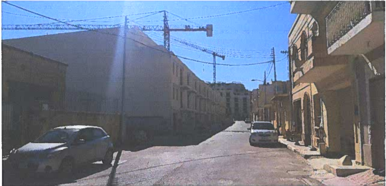
Photo 2 – L-estensjoni enormi tal-Kumpless; kwazi tul ta' triq Ta' Kassja kollha kemm hi. Fil-fond tidher s-sezzjoni li hija murija f'photo 1.

Din is-sezzjoni lahqet gholi ta' 7 sulari filwaqt li s-sezzjoni murija fuq quddiem tilhaq gholi ta' 4 sulari kontra iz-zewg sulari li bihom huma mibnijin d-djar kollha tan-naha l'ohra tat-triq.