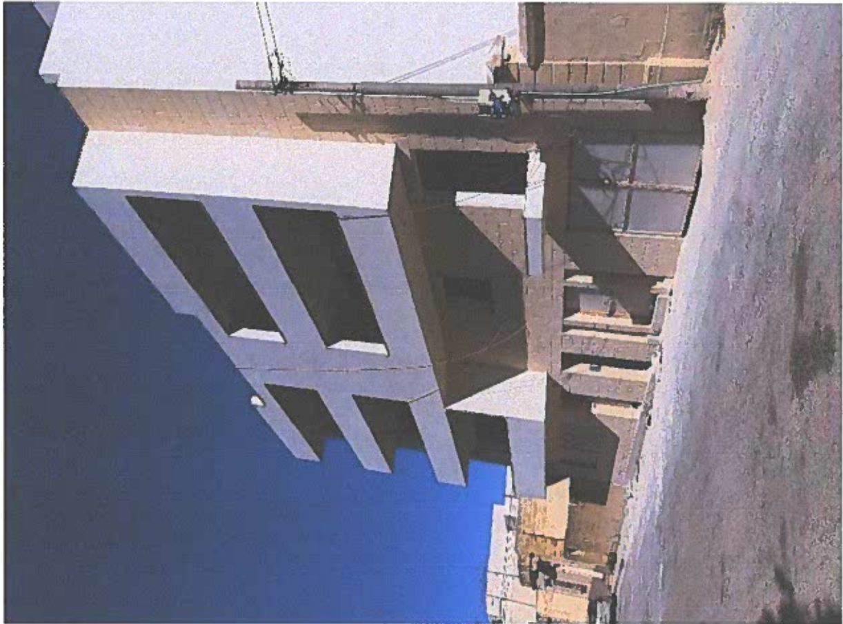
Blokka ohra ta' 5 sulari fi Triq Strickland li turi l-kobor ezagerat fil-konfront tad-djar tal-vicin.