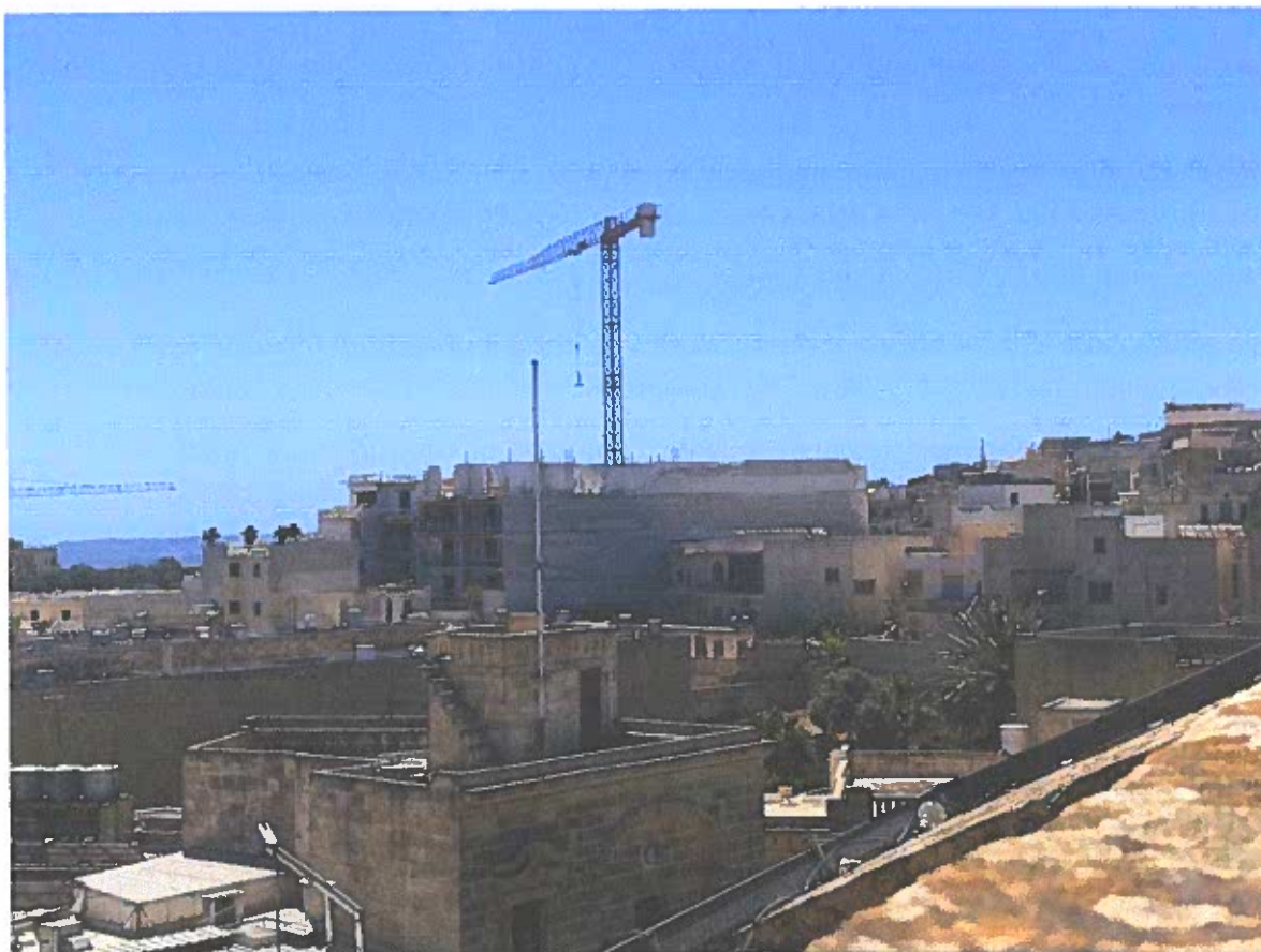
Photo 1 – il-parti tal-kumplex li tmiss mal-girien ta' Triq Wardija. Wiehed jista' jinnota kif il-binja l-gdida radmet totalment l-istruttura l'ohra li kien ilha hemmhekk madwar hamsin sena. Skond il-PA il-binja l-gdida hi regolari, imma fejn huma d-drittijiet tal-girien li spiccaw tilfu anke d-dawl tax-xemx ghal dejjem?